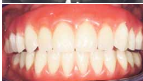
Radiographie de restauration complète avec prothèses sur implants et le résultat visible.

La prosthodontie est l'une des 10 spécialités reconnues par l'Association dentaire canadienne et l'Ordre des dentistes du Québec.