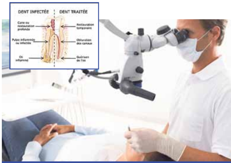
L'endodontiste est appelé à travailler avec un microscope dentaire

3. Lorsqu'il n'y a aucune autre façon de négocier le système canalaire (une obstruction comme la présence d'un pivot radiculaire), un problème irréversible du traitement de canal ou pour une investigation.