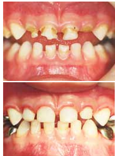
Enfant de 3 ans souffrant de la carie de la petite enfance. Réparation effectuée par un spécialiste en dentisterie pédiatrique

Quoi de plus gratifiant pour un dentiste pédiatre que d'offrir à un jeune adulte, qui amorce sa vie active avec ce bagage inestimable, une dentition confortable et saine dans une bouche en parfaite santé, des habitudes d'hygiène buccale qui lui permettront de réussir n'importe où et n'importe quand grâce à cet outil de communication unique, son sourire!