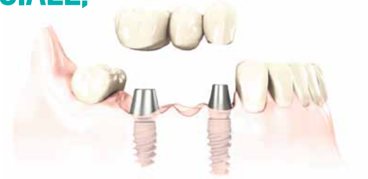
Implants supportant un pont de trois dents