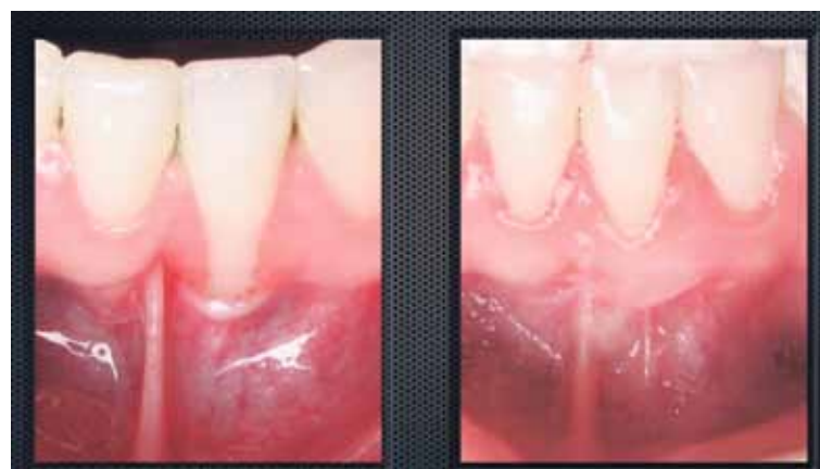
Racine déchaussée et racine après chirurgie de recouvrement

Les hygiénistes dentaires, dentistes généralistes et autres spécialistes dentaires sont des collaborateurs privilégiés des parodontistes; ils jouent un rôle très important dans l'élaboration des traitements visant le maintien d'une condition buccale saine. L'expertise du parodontiste est régulièrement mise à profit dans la planification et l'exécution des traitements impliquant le remplacement des dents par des implants dentaires afin de restituer une dentition fonctionnelle lorsque la détérioration de celle-ci devient trop importante. Par sa vision globale de la condition générale et buccale d'un patient, de l'état de la